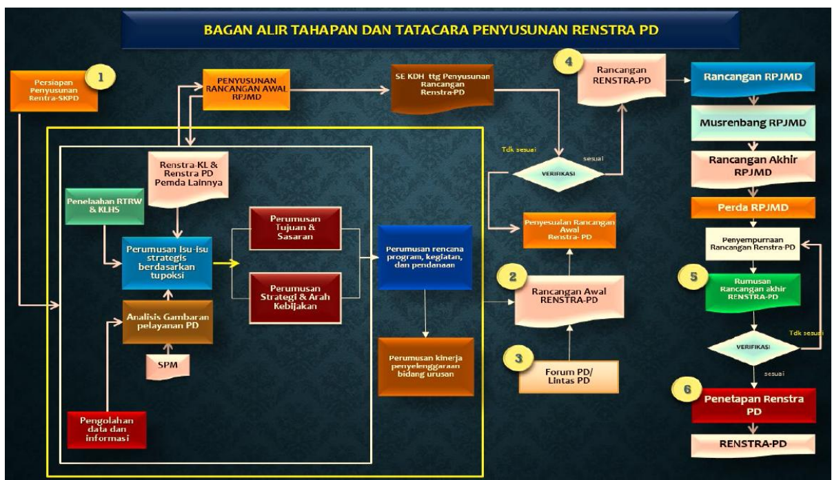
Gambar I. 1 Tahapan dan Tata Cara Penyusunan Renstra PD

Proses penyusunan Renstra Sekretariat DPRD Kabupaten Purbalingga Tahun 2021–2026 dilakukan melalui tahapan persiapan penyusunan, penyusunan Rancangan Awal, Penyusunan Rancangan, Pelaksanaan Forum Perangkat Daerah/Lintas Perangkat Daerah, Perumusan Rancangan Akhir, hingga penetapan Renstra. Keterkaitan serta tahapan penyusunan Renstra Sekretariat DPRD Tahun 2025-2029 mengacu pada Permendagri Nomor 86 Tahun 2017 sebagaimana Gambar berikut ini: